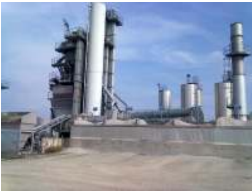
Impianto di recupero rifiuti non pericolosi in comune di Veduggio

Ex autorizzazione Integrata Ambientale: Decreto n. 30 del 29/05/2009 dalla Giunta della Regione del Veneto. Giudizio favorevole di compatibilità ambientale, approvazione del progetto e rilascio dell'Autorizzazione Integrata Ambientale (D.Lgs. n. 152/2006 e s.m.i., art. 23 della L.R. n. 10/99, D.G.R. n. 308 del 10/02/2009 e D.G.R. n. 327 del 17/02/2009: Deliberazione Della Giunta Regionale n. 448 del 10 aprile 2013.