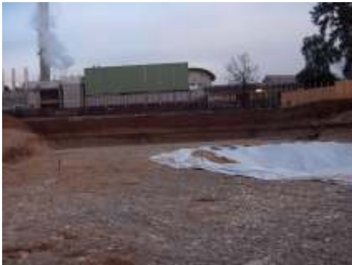
Intervento di bonifica presso Ospedale civile di Montebelluna (Tv)

Sede legale Via Siora Andriana del Vescovo, 7 31100 TREVISO