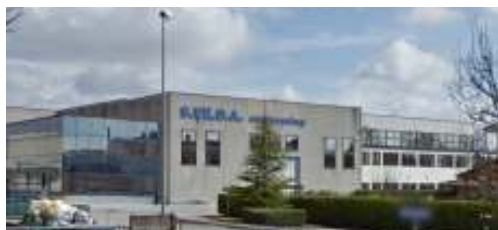
Edificio industriale a Silea (Tv)

Studio di compatibilità, invarianza idraulica e dimensionamento di un'area complessiva di circa 12.000 m 2 , facente parte di un Piano Integrato di Riqualificazione Urbanistica, Edilizia e Ambientale, in comune di Salgareda (Treviso), nell'area denominata "Ex Enopoli". Importo opere € 500.000,00. Periodo: anno 2009.