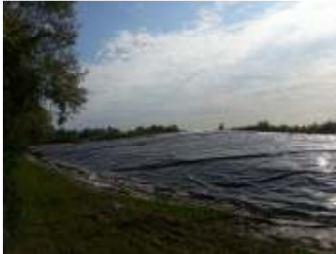
Discarica per rifiuti non pericolosi in comune di Silea (Tv)