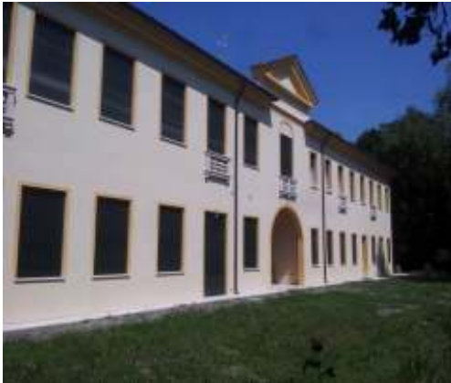
Ristrutturazione a Villorba (Tv) - Progetto e D.L. strutture -

Sede legale Via Siora Andriana del Vescovo, 7 31100 TREVISO