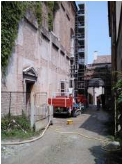
Esecuzione di sondaggio a carotaggio continuo alla profondità di 10 m presso cantiere a Treviso

Sede legale Via Siora Andriana del Vescovo, 7 31100 TREVISO