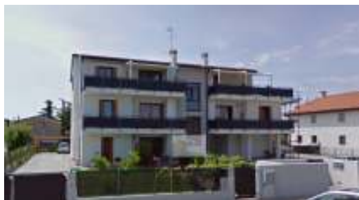
Edificio residenziale a S. Donà di Piave (Ve)

Progettazione strutturale-esecutiva di strutture in carpenteria metallica presso capannone sito in impianto in comune di Ceggia (VE). Prestazione eseguita. Periodo: 2019.