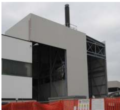
Edificio industriale in provincia di Venezia

Progettazione definitiva ed esecutiva, coordinamento per la sicurezza in fase di progettazione relativi all'esecuzione di lavori di miglioramento sismico della scuola secondaria di primo grado "Tito Livio" ai sensi dell'art. 36, c.2, lett. a) D. Lgs, 50/2016. Importo lavori in appalto Euro 410.000,00. Committente: Comune di Teolo (Pd). Intervento eseguito. Periodo 2018.