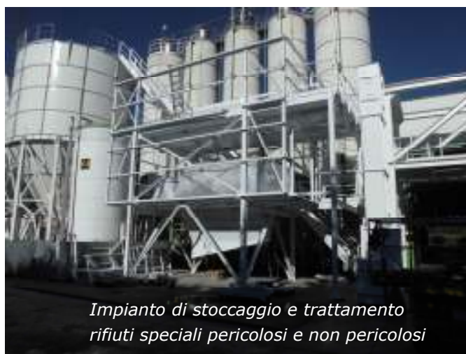
Impianto di stoccaggio e trattamento rifiuti speciali pericolosi e non pericolosi