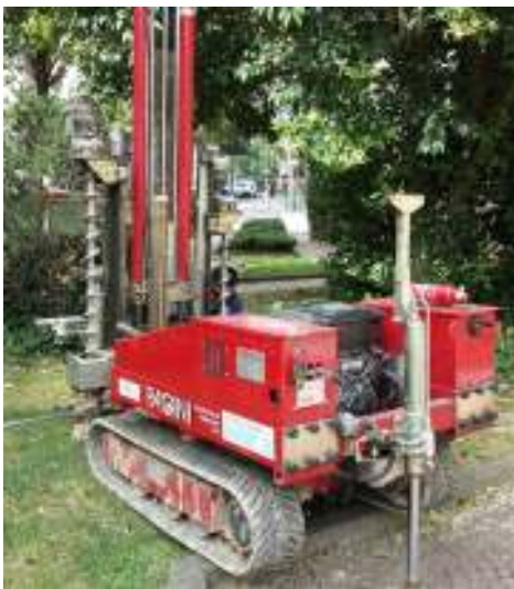
Esecuzione di prova penetrometrica statica presso cantiere a Treviso