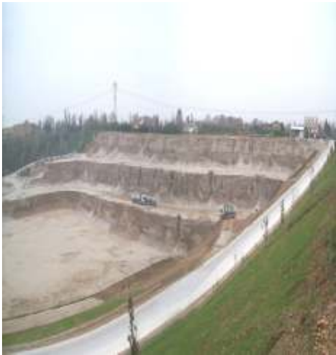
Discarica per rifiuti inerti in corrispondenza di cava di ghiaia in comune di Montebelluna (Tv)

Cava di ghiaia denominata "S. Gaetano": riprofilatura del bacino a volume di scavo invariato. Procedura di V.I.A. e contestuale approvazione del progetto. Intervento in corso di istruttoria. Anno 2018.