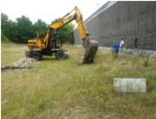
Bonifica e messa in sicurezza di una ex cava in provincia di Verona: campagna d'indagine del fondo

Indagine ambientale per la dismissione dell'impianto di conceria e trasformazione ad area residenziale. Periodo 2004.