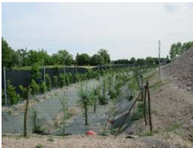
Impianto di fitoevapotrspirazione

Progetto di depurazione delle acque di scarico mediante la fito depurazione per Ditta Committente di Vazzola (TV): centro di autodemolizione di macchine militari.