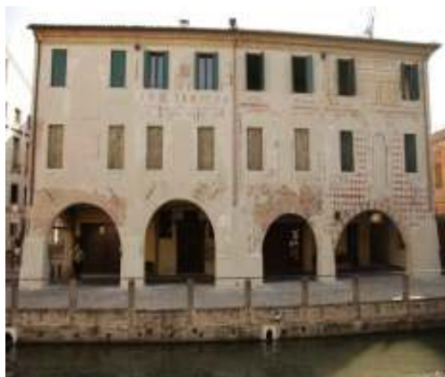
Ristrutturazione edificio residenziale

Sede legale Via Siora Andriana del Vescovo, 7 31100 TREVISO