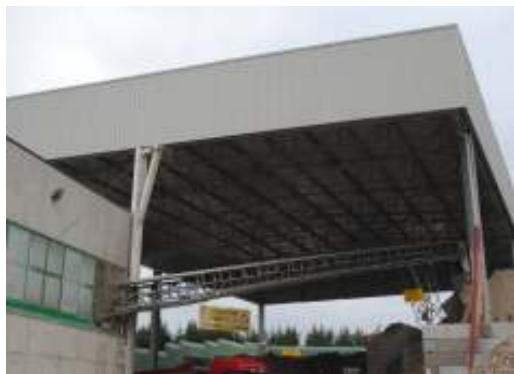
Edificio carpenteria metallica a Noale (Ve)

Progetto per la realizzazione di un magazzino e di una tettoia per il ricovero di bombole, in adiacenza al capannone produttivo esistente, in comune di Silea (Tv): redazione progetto esecutivo e costruttivo con dettagli e particolari di officina, coordinamento per la sicurezza in fase di progettazione. Prestazione eseguita. Periodo: 2018.