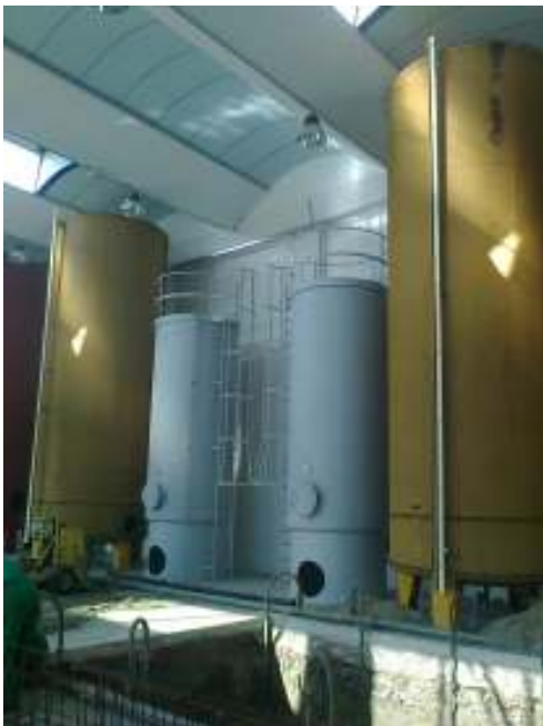
Impianto di recupero a Jesolo (Ve)

Ampliamento opificio di Riese Pio X. Pratica da produrre allo Sportello Unico Attività Produttive del comune di Riese: Compatibilità idraulica ai sensi della DGRV 2948 del 06.10.2009, Indagine geologica ai sensi delle NTC 08 e ambientale ai sensi della DGRV 2424/2008, Istanza per autorizzazione allo scarico acque di prima pioggia e comunque ottemperanza all'art. 39 PTA, Documentazione tecnica finalizzata al rilascio del parere ambientale A.R.P.A nei procedimenti dello Sportello Unico per le attività produttive. Periodo 2012.