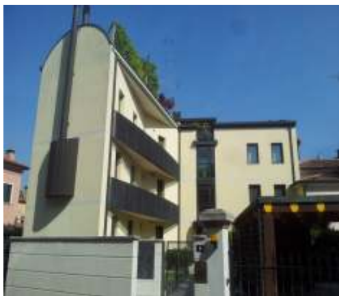
Edificio residenziale a Treviso - Progetto e D.L. strutture -

Progetto e Direzione Lavori di ripristino strutture in c.a. di capannone fortemente danneggiato da esplosione, sito in zona industriale di Povegliano Veronese per totali 1.200 mq. Dimensionamenti strutturali, ripristini con fibre di carbonio, strutture in opera, prove di carico finali. Periodo: 2014.