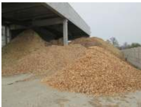
Impianto di recupero a Noale (Ve)

Adeguamento logistico/operativo dell'impianto di smaltimento e recupero di rifiuti speciali pericolosi e non pericolosi. Modifica alla D.G.R. n. 2399 del 29/11/2011. Comune di localizzazione: Cassola (VI). Esclusione dalla procedura di V.I.A con Decreto Regione Veneto n. 74 del 10.9.2018. In fase di redazione la variante ai sensi art. 29-ter D. Lgs. 152/06. Anno 2018-2019.