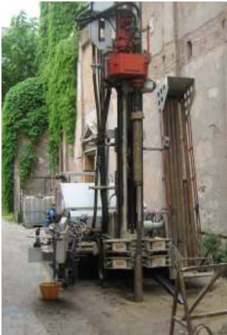
Esecuzione di sondaggi a carotaggio continuo, con corona diamantata, diametro di perforazione pari a 125 mm presso cantiere a Treviso

Progetto di restauro ed adeguamento funzionale del Fontego Dei Tedeschi a Venezia. Lo studio è stato impostato sulla base delle indicazioni riportate al capitolo 6 delle "Norme tecniche per le costruzioni" approvate con D.M. del 14 gennaio 2008 e della Circolare 2 febbraio 2009 nr. 617 "Istruzioni per l'applicazione delle NCT". Esecuzione della seguente campagna d'indagini geotecniche che definisce il modello geologico e geotecnico del sito: nr. 2 sondaggi geognostici a carotaggio continuo spinti fino alla profondità di 30 m con esecuzione, in corrispondenza dei principali livelli sabbiosi, dei Standard Penetration Test (SPT). Prelievo di 2 campioni indisturbati per sondaggio con esecuzione di prove di laboratorio per la caratterizzazione completa dei livelli argillosi. Redazione di elaborato di contenuto geologico tecnico, completo di allegati grafici e documentazione fotografica.