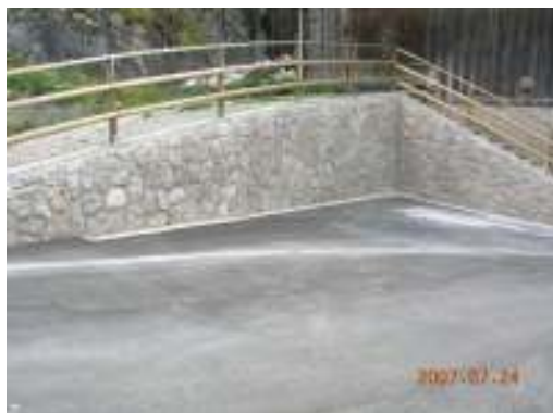
Lavori di sistemazione del centro storico del comune di Livinallongo del Col di Lana (Bl)

Collaudo tecnico-amministrativo in corso d'opera delle opere di urbanizzazione primaria nell'ambito del Piano di Lottizzazione "Celsi" in comune di Treviso. Determinazione Dirigenziale n. 885. Periodo 2019.