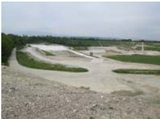
Ampliamento di discarica per rifiuti inerti in comune di Trevignano (TV)