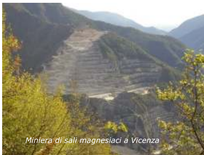
Miniera di sali magnesiaci a Vicenza