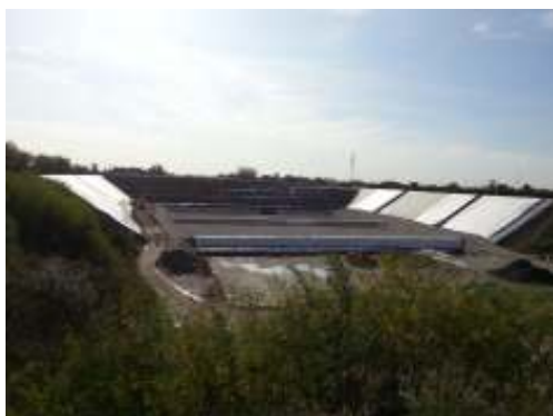
Recupero ambientale dell'ex cava Siberie mediante la progettazione definitiva per la costruzione e la gestione operativa e post-operativa di una discarica controllata in comune di Sommacampagna (Vr)

Discarica per rifiuti inerti denominata "Postumia 2" in comune di Trevignano (TV).