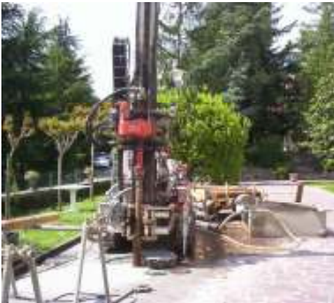
Esecuzione di sondaggio a carotaggio continuo alla profondità di 10 m presso cantiere a Tarzo (Tv)

Indagine geologica connessa all'attività di verifica sismica dell'asilo nido comunale in via Mondin in comune di Belluno: indagine geosismica volta ad individuare la categoria sismica del terreno sulla base della velocità equivalente delle Onde S ( V_{s_{eq}} ) realizzata tramite tecnica MASW E ReMi.