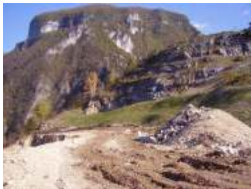
Miniera di sali magnesiaci a Vicenza

Studio di Impatto Ambientale inerente il progetto di coltivazione di una nuova cava di ghiaia denominata "Sofia 2" in comune di Loria. In corso di istruttoria. Periodo 2011.