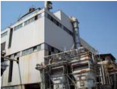
Impianto di conversione "Kaldo" per la produzione di rame raffinato

Impianto di recupero rifiuti speciali non pericolosi in comune di Vedelago, allo scopo di produrre asfalto recuperando il fresato codice 170302 : Progetto e valutazione di impatto ambientale. autorizzazione all'esercizio per il recupero fino a 90.000 tonnellate di fresato d'asfalto. DDP n. 655/2013 del 20.12.2013.