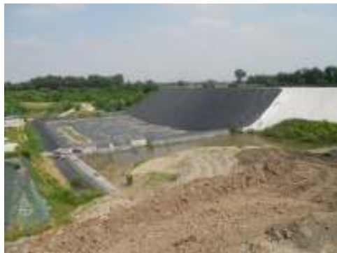
Discarica per rifiuti non pericolosi in comune di Loria (Tv)